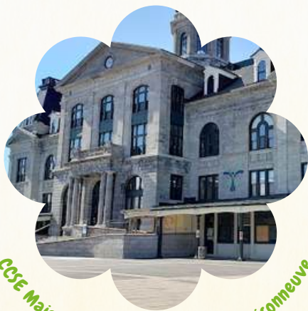
CCSE Maisonneuve - Vieux marché Maisonneuve

« On s'implique dans la communauté depuis plus de 50 ans ! »