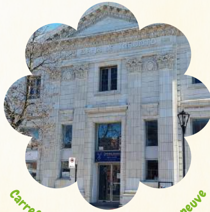
Carrefour Jeunesse du CCSE Maisonneuve