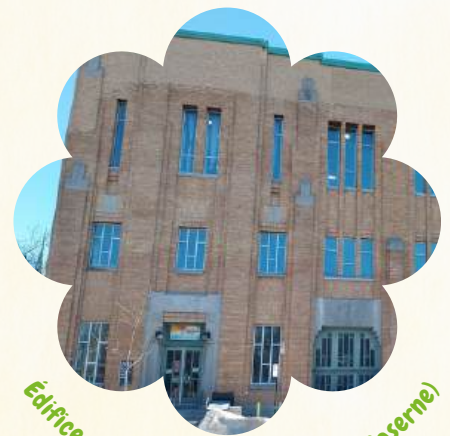
Édifice Emmanuel-Arthur Doucet (Caserne)